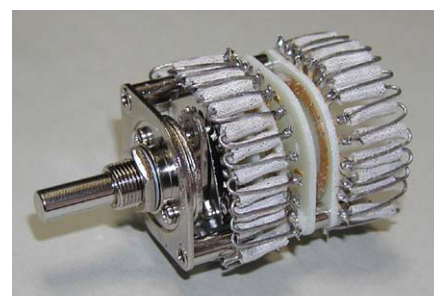
アッテネーターの例

リード線が非磁性でもキャップは磁性体（主に鉄）という製品がございます。鉄を使うと音がニゴリ、荒れる傾向があります。本品のキャップ部の勘合は強度が高くリード線の雑な手曲げにも問題はありませんが、繰り返し曲げ加工を行うことはリード線の損傷、また音の劣化に繋がるのでお止めください。